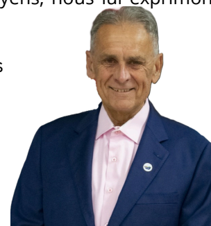
Daniel Laviolette, maire

En cette saison de renouveau, toute l'équipe municipale se joint à moi pour vous souhaiter un printemps agréable, sécuritaire et inspirant, rempli de beaux projets.